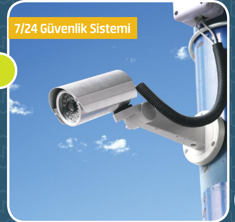
Kamera ile Güçlendirilmiş Özel Güvenlik