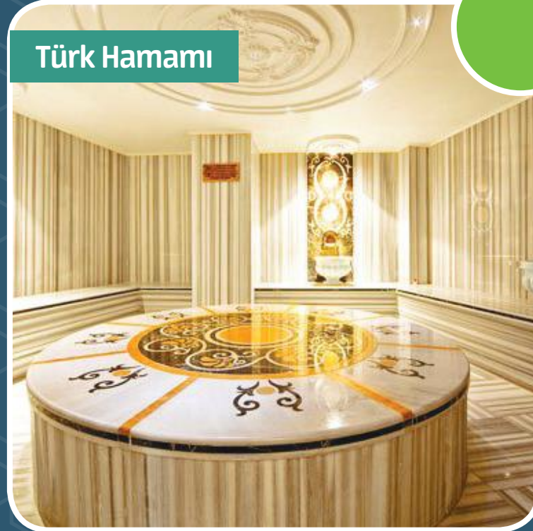
Rahatlayabileceğiniz Türk Hamamı