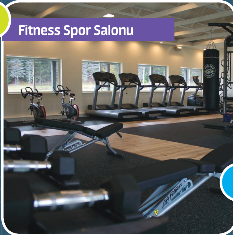
Spor Salonu Yanbaşınızda