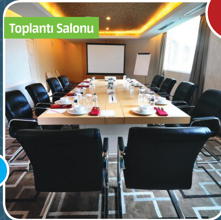
Yönetim Toplantıları için Toplantı Salonu