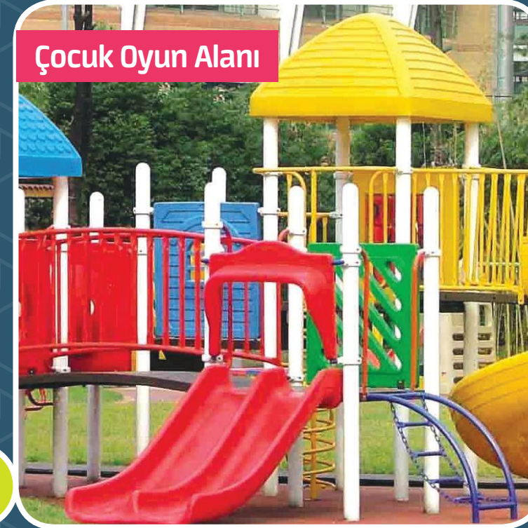
Çocuklarımız için Çocuk Oyun Alanı