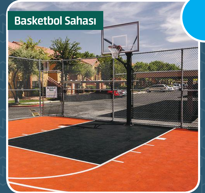
Gençler ve Genç Kalanlar için Basketbol Sahası