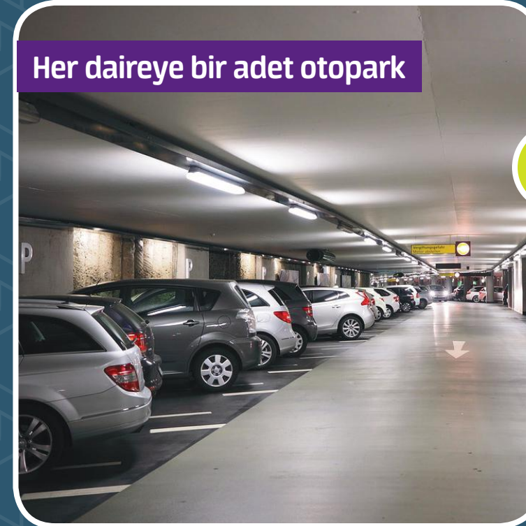
Aracınızı Güvenle Park Edeceğiniz Kapalı Otopark